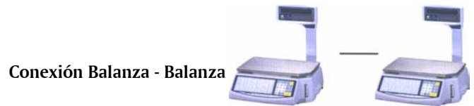
Conexión Balanza - Balanza