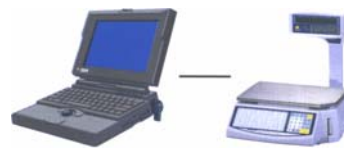
Conexión PC - Balanza

Una impresora termal moderna imprimiendo a 100mm/seg. (4"/seg.), la LS-100 se diseño con funciones de auto-impresión en mente. Nuestro sistema de Cartucho innovador, la LS-100 puede ser recargado con etiquetas rápido y fácilmente. Con capacidad de rollos de etiqueta superior a la mayoría de balanzas, la LS-100 te permite alcanzar máxima productividad con el mínimo tiempo caído. Combinamos todas estas grandes funciones con una Biblioteca de Formatos de Etiqueta® que contiene los formatos de etiquetas más populares. ¡Con tanta flexibilidad, la LS-100 puede ser fácilmente adaptada para reemplazar cualquier balanza sin tener que cambiar tu inventario corriente de etiquetas! Y con soporte multi-lenguaje (ingles, Coreano, español...) combinando con funciones de ingredientes, "safe handling", Por-Peso, Por-Pieza, o cualquier requisito de impresión básico, nunca vas mal si usas la LS-100!